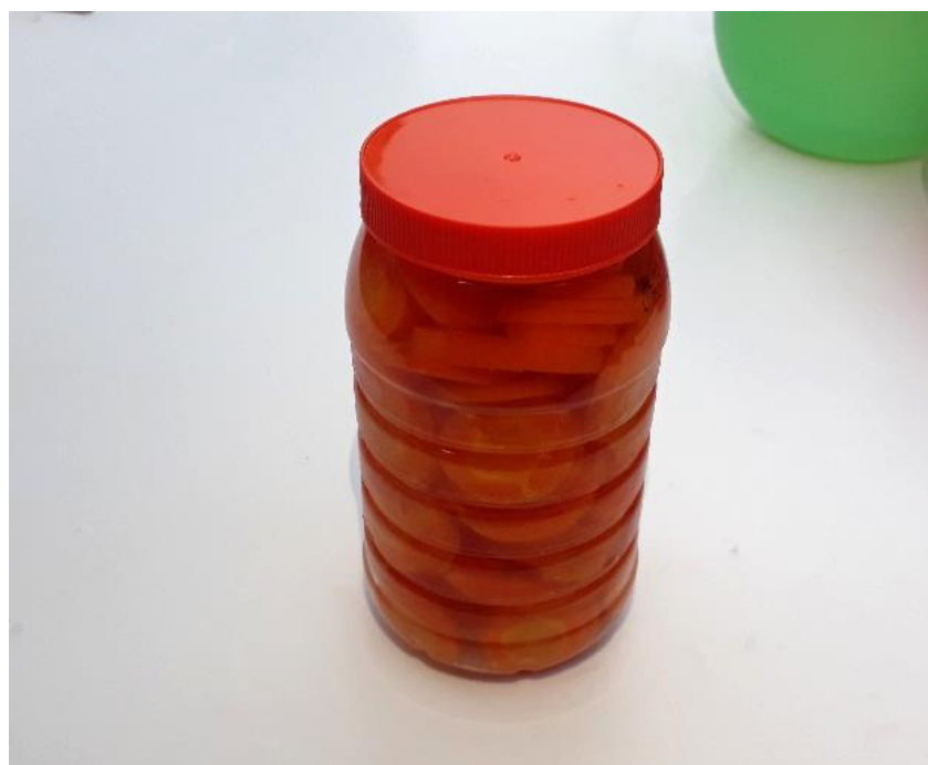
Conserva de cenoura